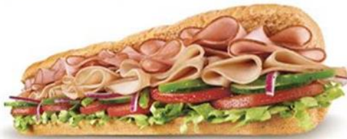
PAVO Y JAMÓN